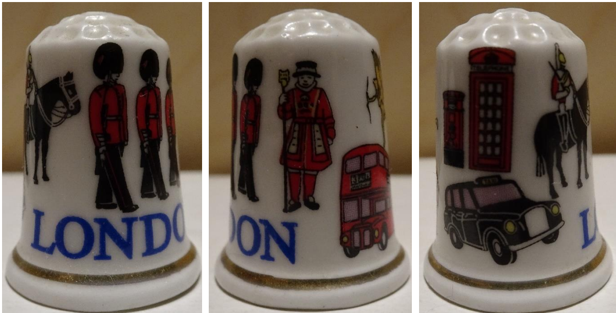
Zdj. 3. Naparstek nr 1 w kolekcji

JS: Niewątpliwie taka pasja wiąże się również z zamiłowaniem do podróżowania. Czy to jest główny sposób pozyskiwania okazów do kolekcji?