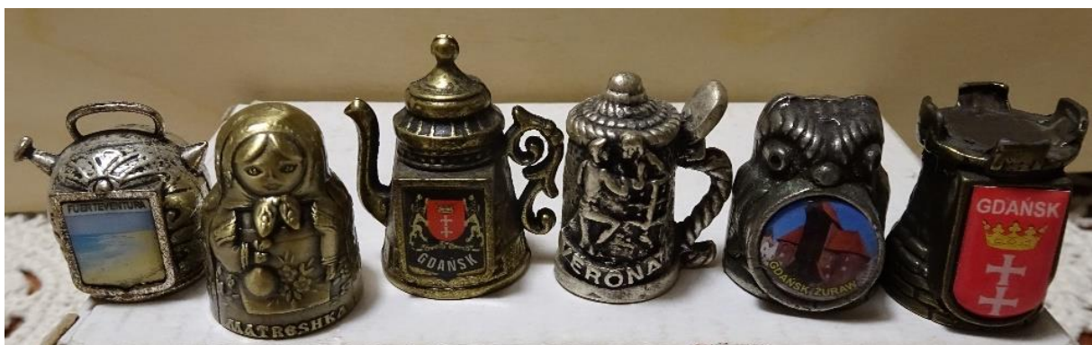
Zdj. 7. Niektóre naparstki zadziwiają swoim kształtem