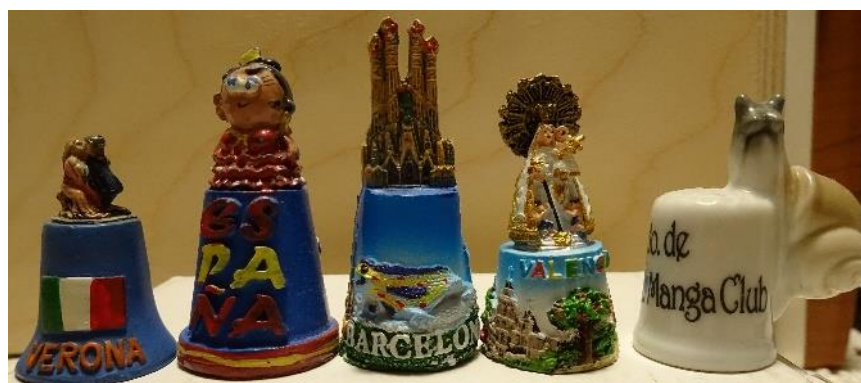
Zdj. 8. Zachwycają swoimi kolorami

JS: A najdalsza podróż i związane z nią trofea?