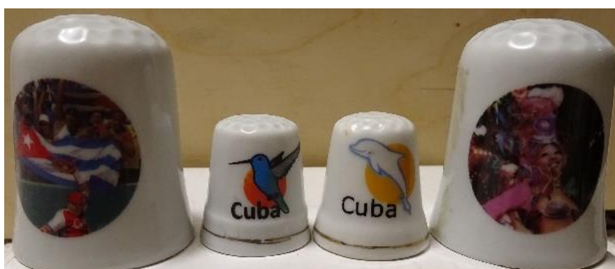
Zdj. 9. Napastrki kubańskie

ZAK: Sporo napastrków przywoziłem z wycieczki po Kubie. Ciekawostką jest to, że niektóre są zdecydowanie większe od standardowych. Na dzień dzisiejszy mogę powiedzieć, że posiadam napastrki prawie ze wszystkich krajów Europy oraz kilkadziesiąt pochodzących z innych kontynentów. Niektóre są oryginalnie zapakowane jak przykładowo napastrzek z Sankt Petersburga.