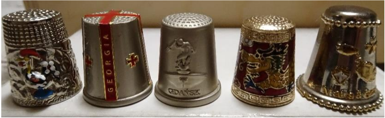
Zdj. 4. Naparstki metalowe