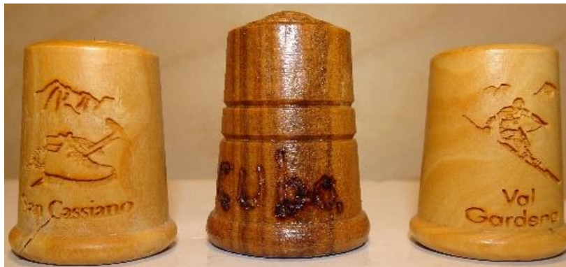
Zdj. 5. Naparstki wykonane z drewna