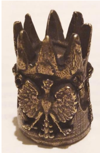
Zdj. 1. Jeden z okazów z numerem 827 w kolekcji Z. A. Kuczy

Pasja jest wyrazem zapożyczonym z łac. passio (cierpienie) i funkcjonuje w języku polskim od XVI wieku. Początkowo występowała tylko w znaczeniu religijnym jako ewangeliczny opis męki Chrystusa, następnie określała nabożeństwa wielkopostne oraz dzieła plastyczne (zwłaszcza krucyfiks zwany pasyjką). Znana jest również z nazewnictwa dzieł muzycznych. Począwszy od XVIII wieku, zapewne pod wpływem francuskiego passion , wyraz pasja zaczął funkcjonować w polszczyźnie ogólnej w znaczeniu „bardzo silne upodobanie do czegoś, zajmowanie się czymś z namiętnością”, np. pasja badawcza, pasja do podróżowania, pasja kolekcjonerska.