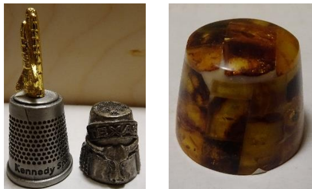
Zdj. 6. Okazy wykonane ze srebra oraz bursztynu