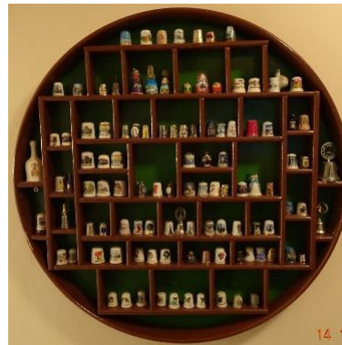
Zdj. 11. Fragment ekspozycji kolekcji

JS: Dziękuję bardzo za rozmowę i życzę dalszych ciekawych podróży i oczywiście równie fascynujących pamiątek w postaci kolejnych naparstków.